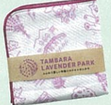
ガーゼタオルはんかち