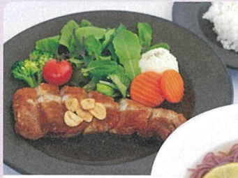
上州麦豚 ポークステーキ