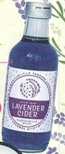
ラベンダー サイダー