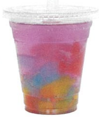
ラベンダー ソフトクリーム