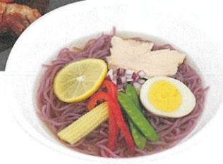
冷やしラベンダー ラーメン