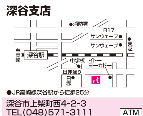
中央労働金庫深谷支店